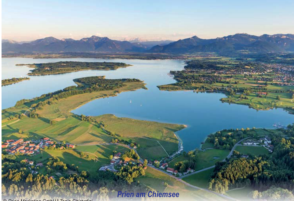
Prien am Chiemsee