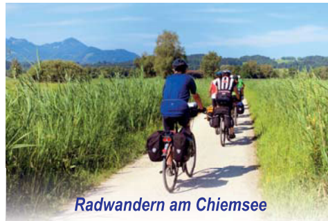
Radwandern am Chiemsee