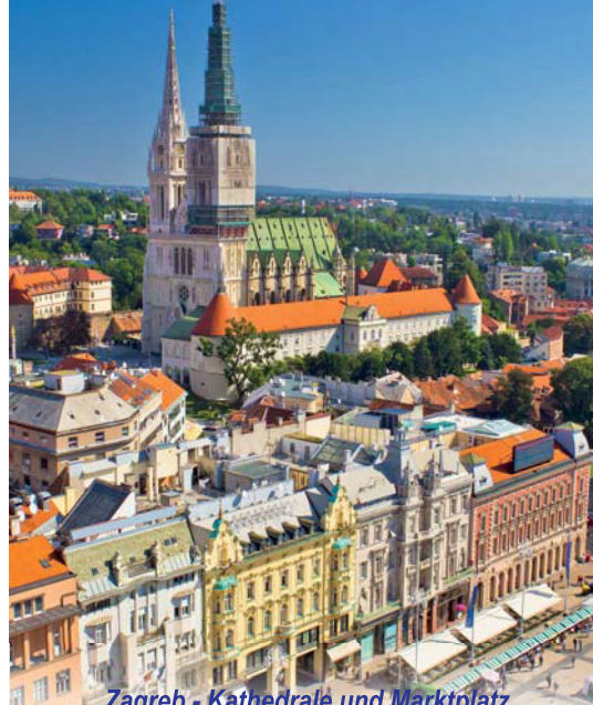
Zagreb - Kathedrale und Marktplatz