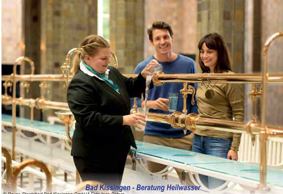
Bad Kissingen - Beratung Heilwasser