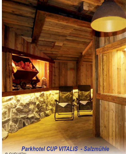
Parkhotel CUP VITALIS - Salzmühle